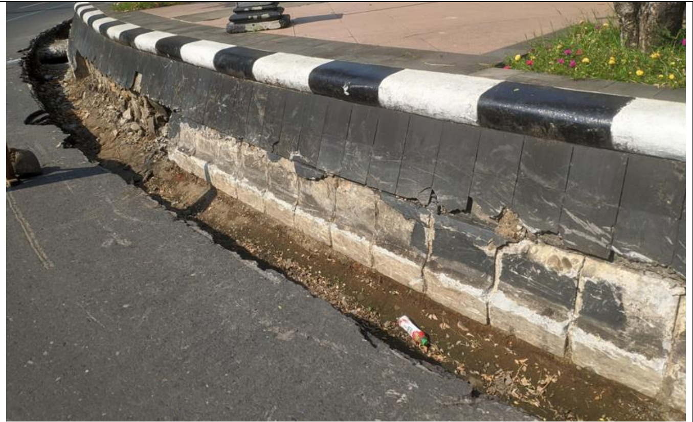
SIMPANG LIMA SEMARANG

KEGIATAN : NORMALISASI SALURAN KAWASAN SIMPANG LIMA (LANJUTAN)