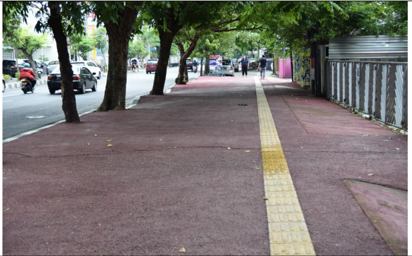
JL MT HARYONO