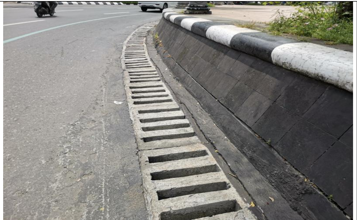
SIMPANG LIMA SEMARANG