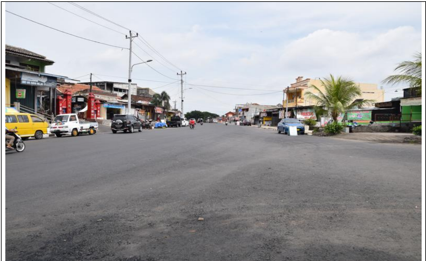
JL WR SUPRATMAN

KEGIATAN : PENINGKATAN JALAN WR SUPRATMAN