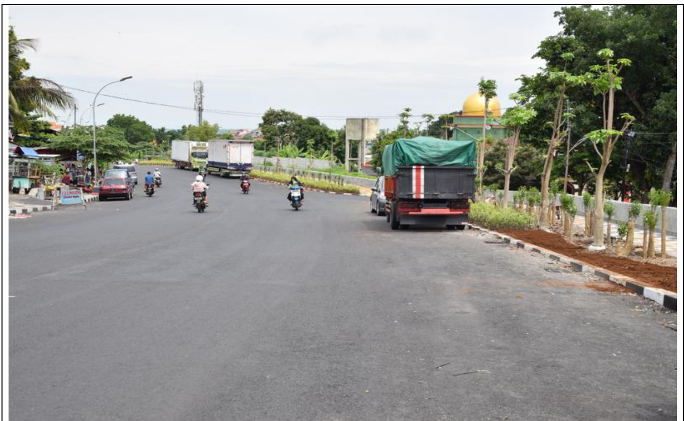
JL WR SUPRATMAN