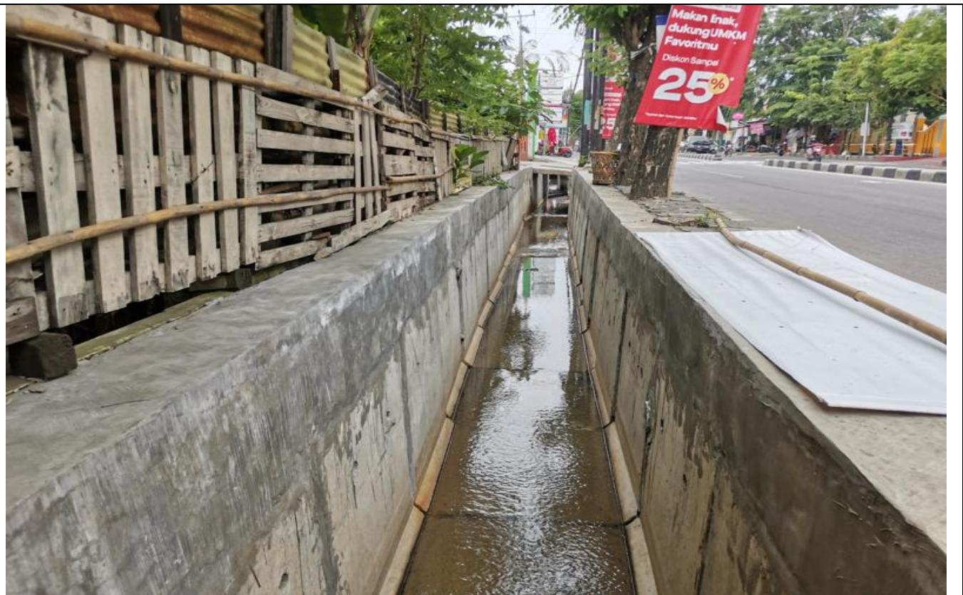
JL KEDUNGmundu RAYA