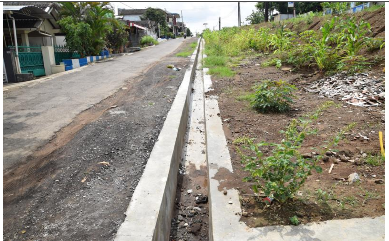
JL GATOT SUBROTO