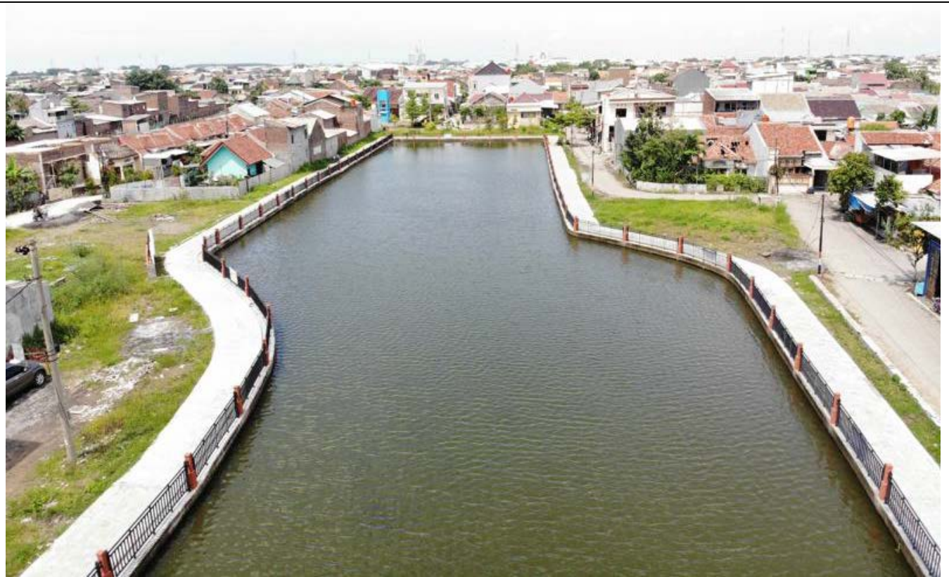
MUKHTIHARJO KIDUL 21 DESEMBER 2021

KEGIATAN : PEMBANGUNAN KOLAM RETENSI MUKDUL II (LANJUTAN)