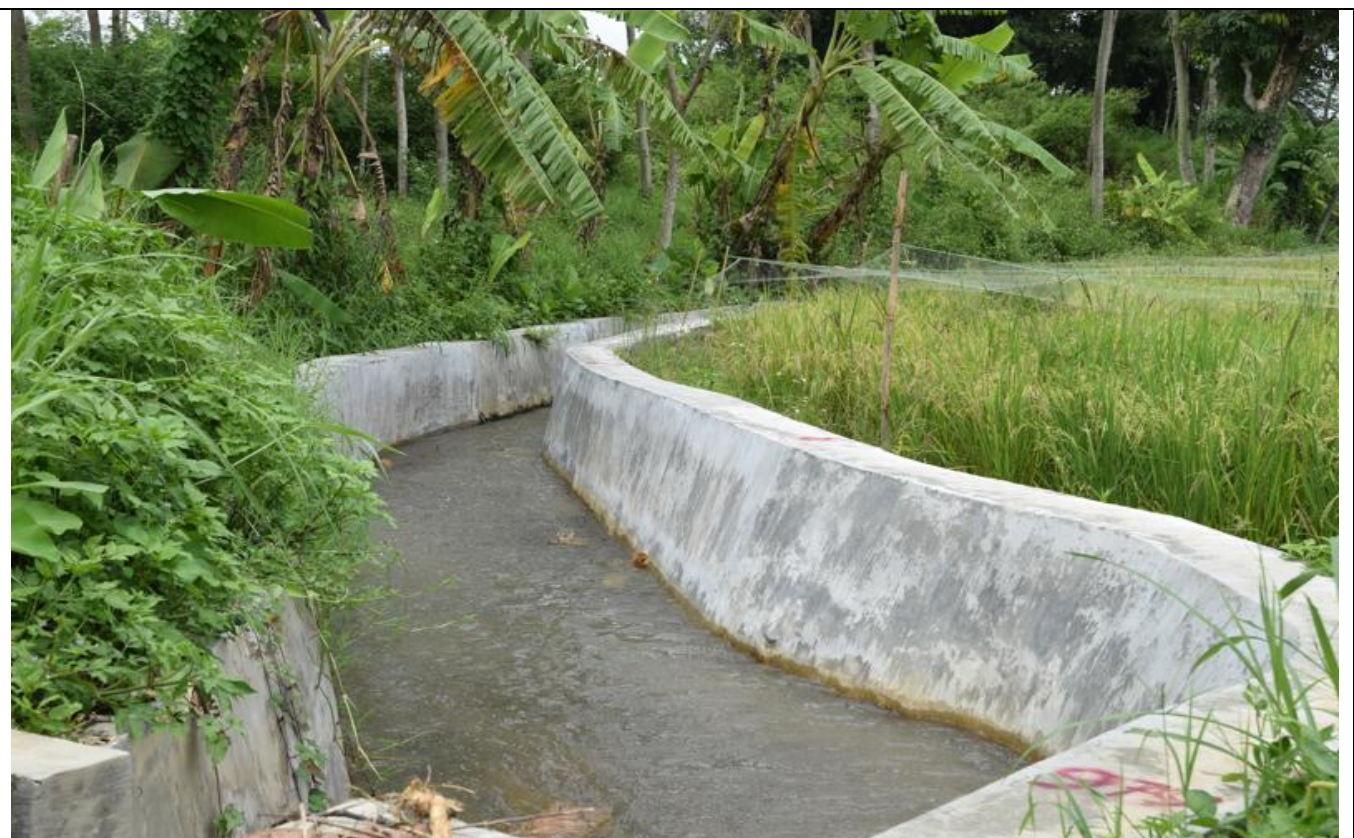
D I BLORONG