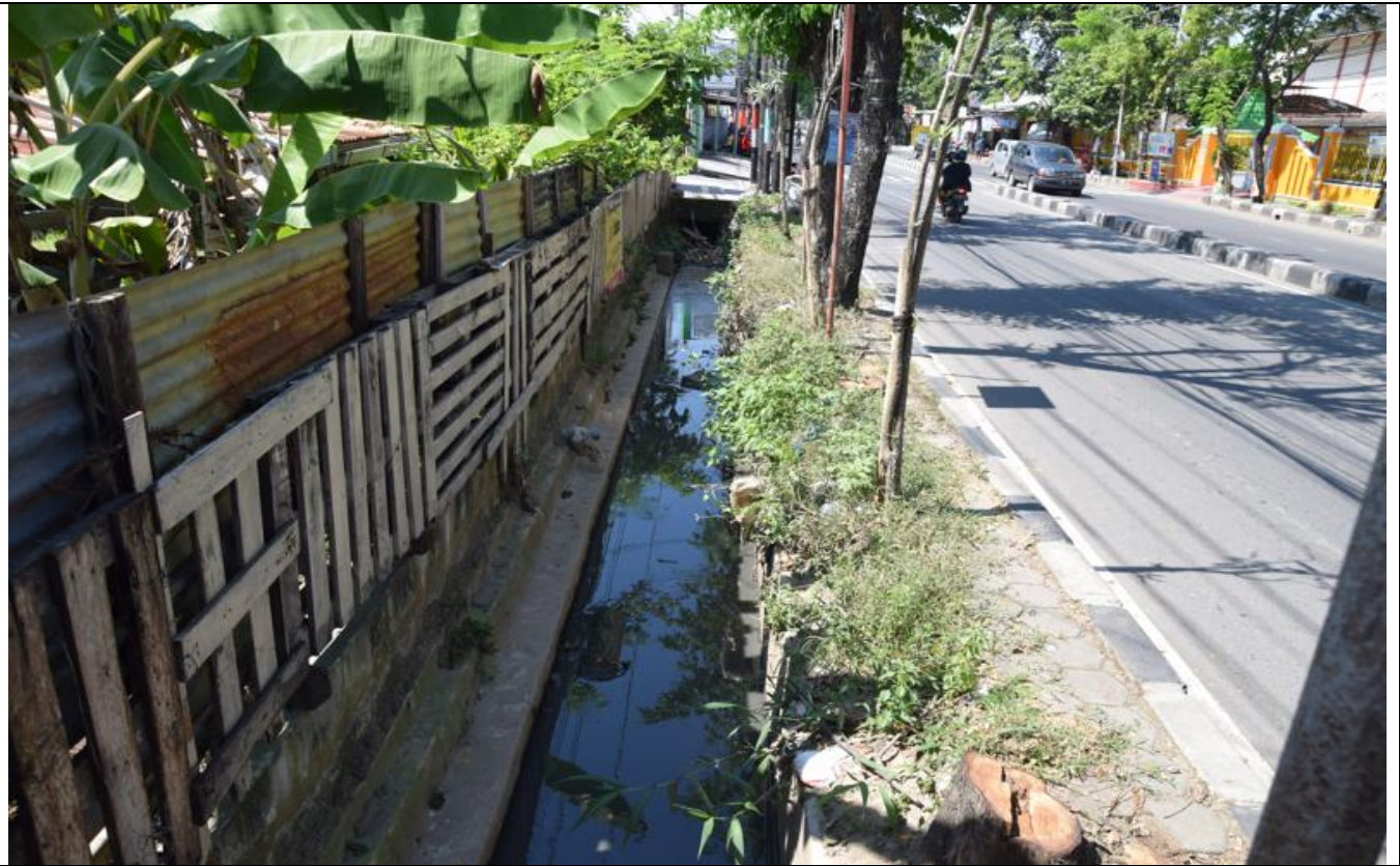
JL KEDUNGmundu RAYA

KEGIATAN : NORMALISASI SALURAN KAWASAN KEDUNGmundu RAYA