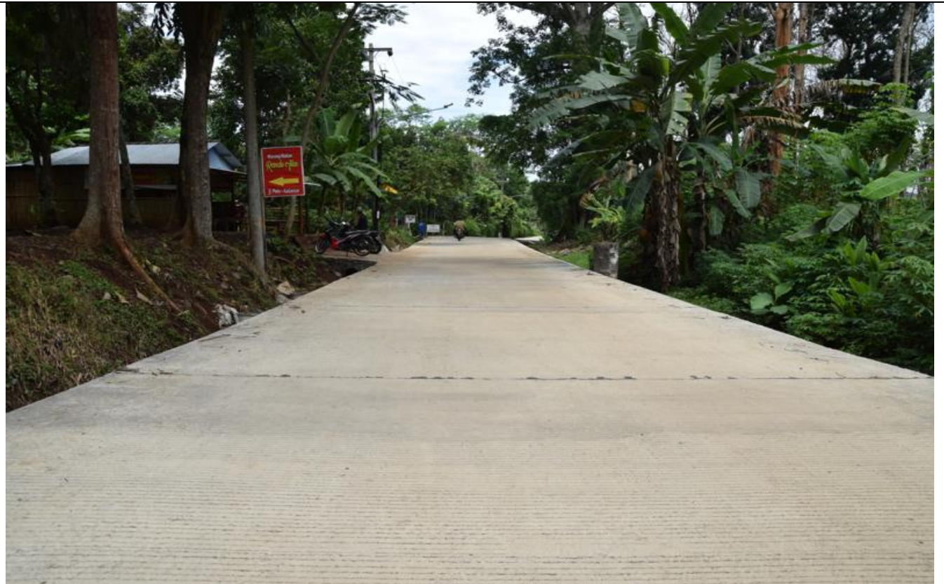
JL NGADIRGO - PALIR

KEGIATAN : PENINGKATAN JALAN NGADIRGO – PALIR (BAN PROV)