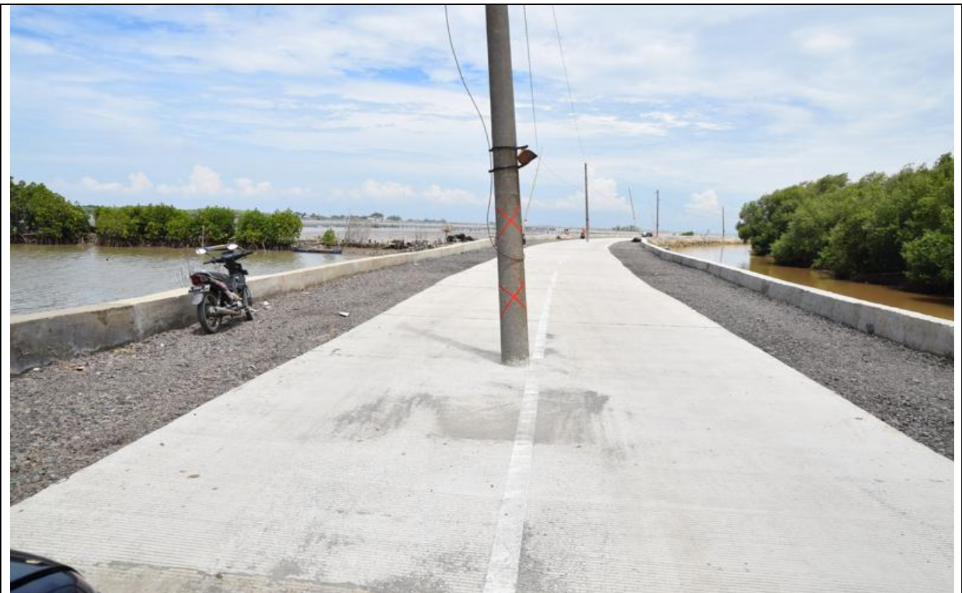
IRIGASI UTARA (MANGKANG KULON)