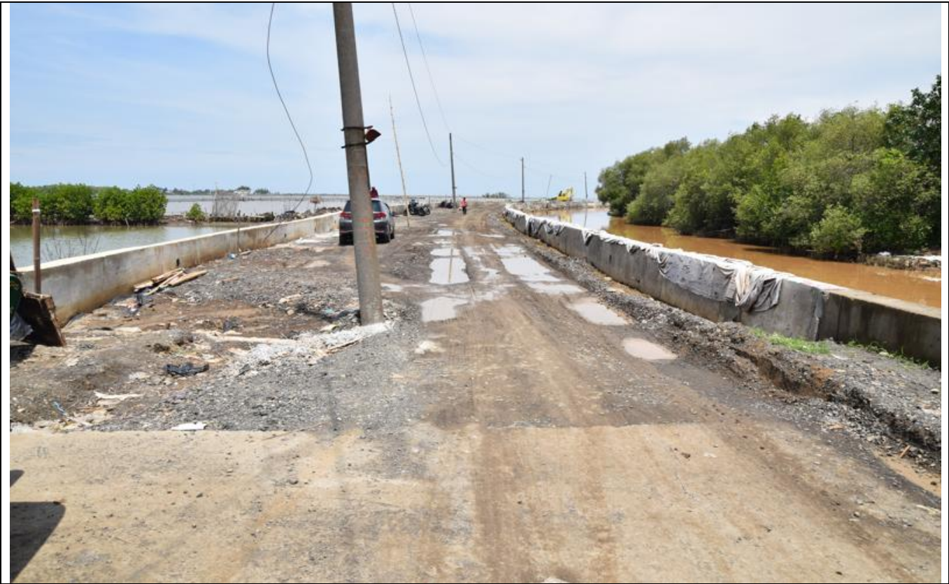
IRIGASI UTARA (MANGKANG KULON)

KEGIATAN : PENINGKATAN JALAN IRIGASI UTARA (MANGKANG KULON)