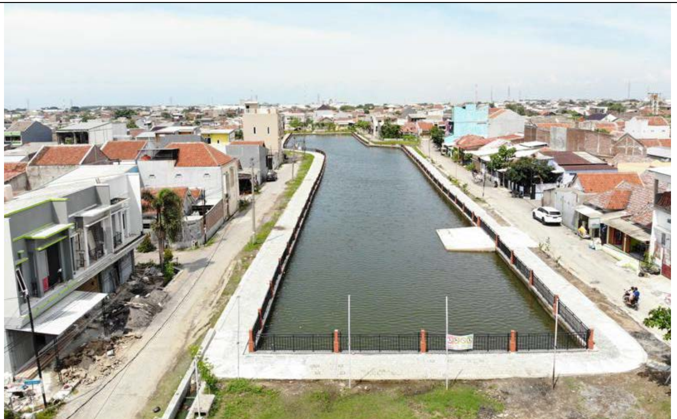
MUKHTIHARJO KIDUL 21 DESEMBER 2021