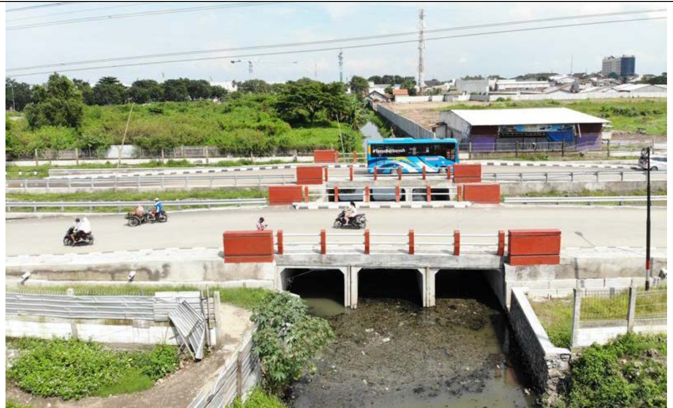
KANDANG KEBO SEMARANG

KEGIATAN : PENINGKATAN PENGENDALI BANJIR KANDANG KEBO