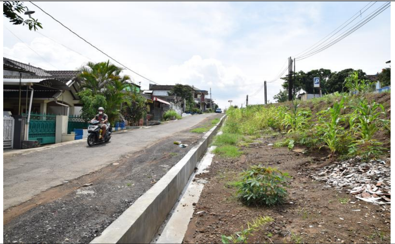
JL GATOT SUBROTO

KEGIATAN : PENINGKATAN SALURAN GATOT SUBROTO