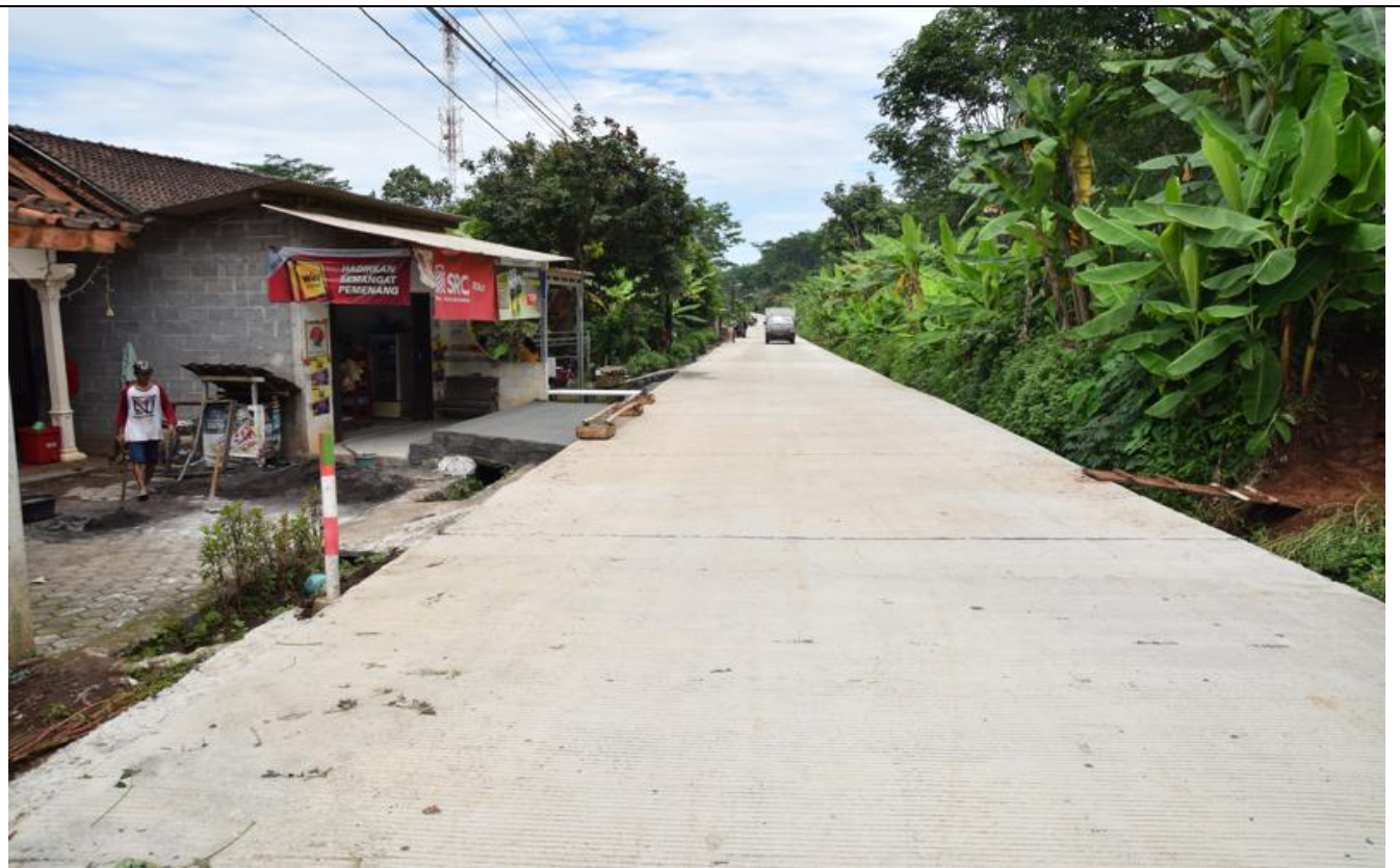
JL NGADIRGO - PALIR