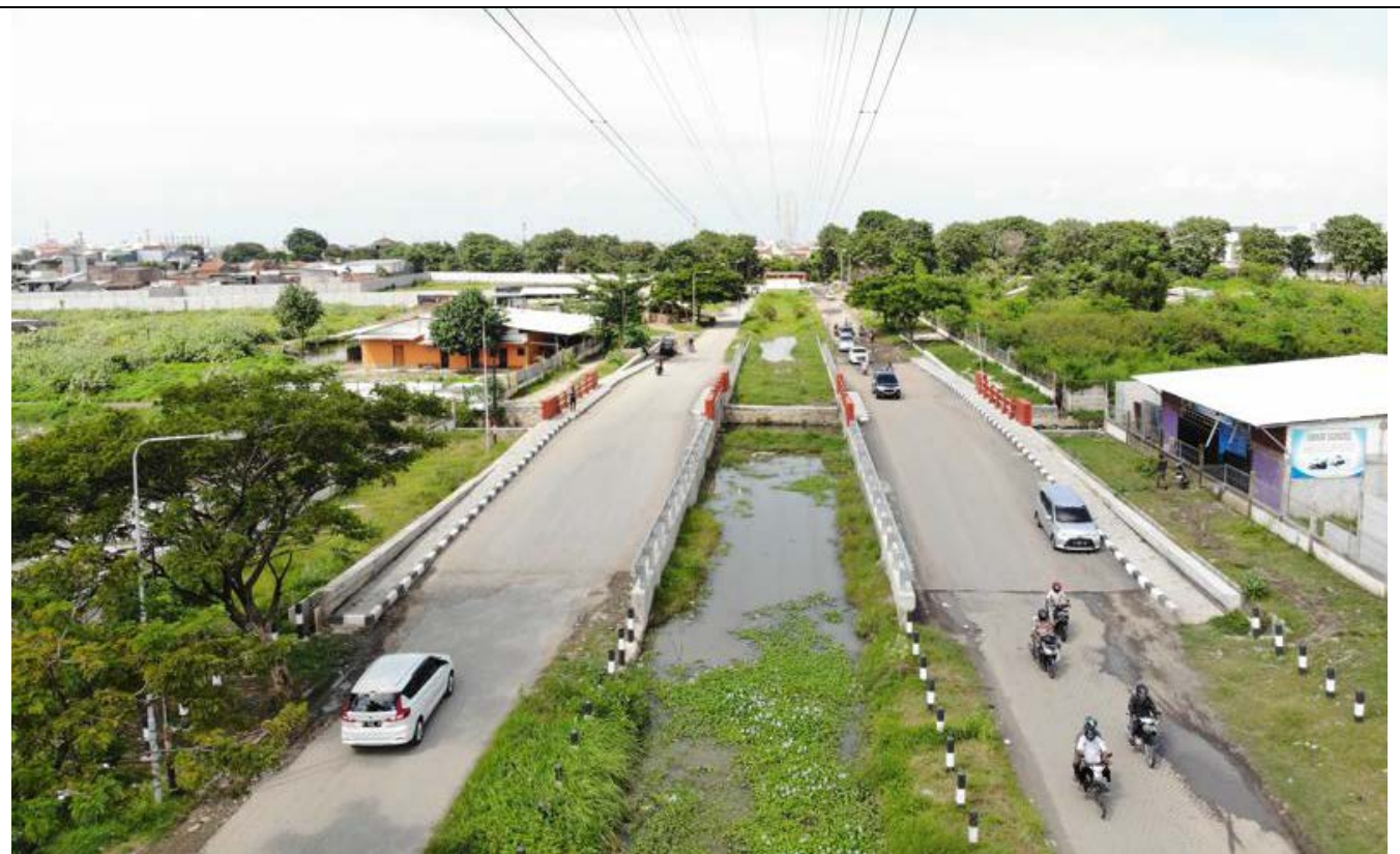
KANDANG KEBO SEMARANG