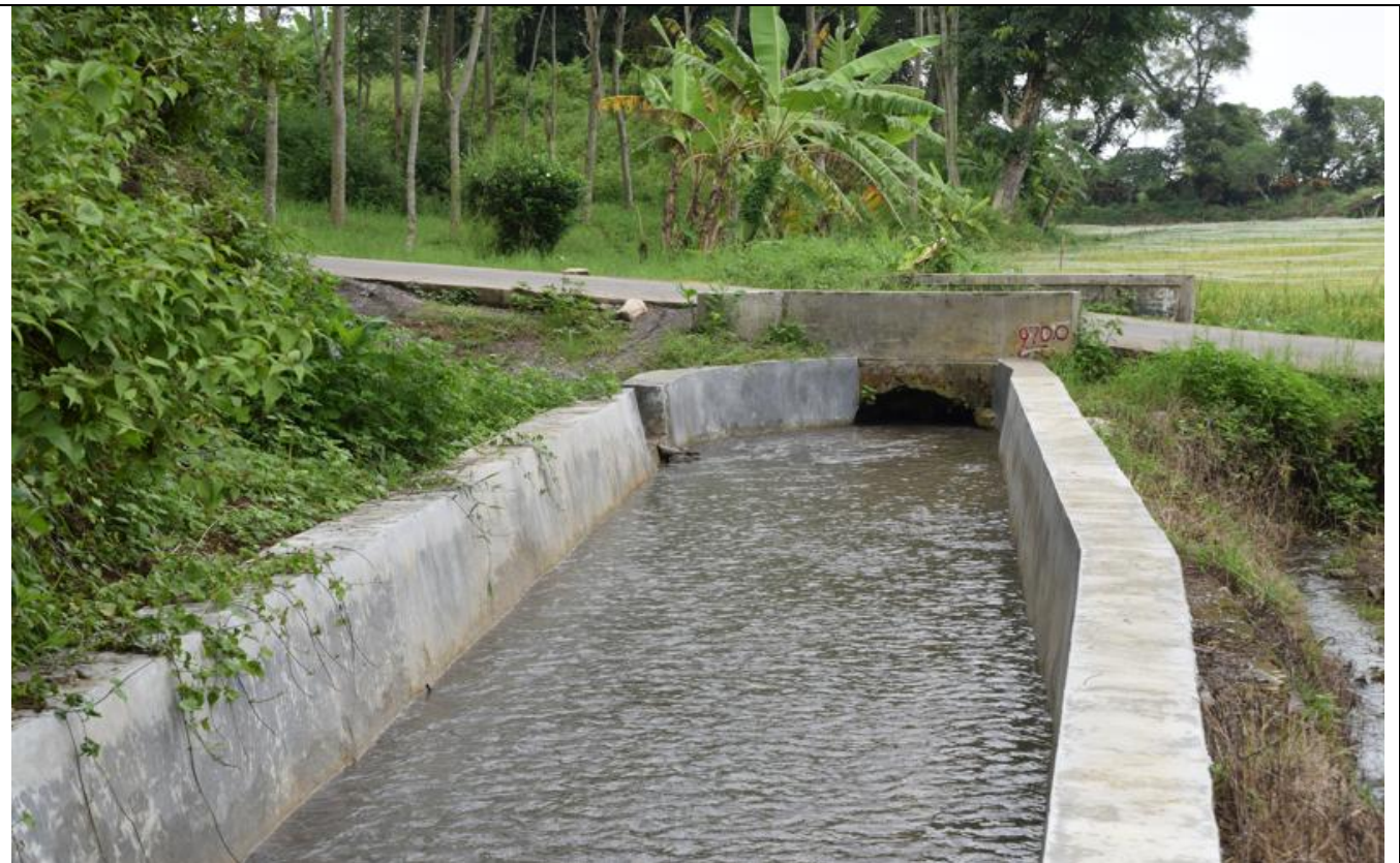
D I BLORONG

KEGIATAN : REHABILITASI JARINGAN IRIGASI D.I BLORONG TAMBANGAN